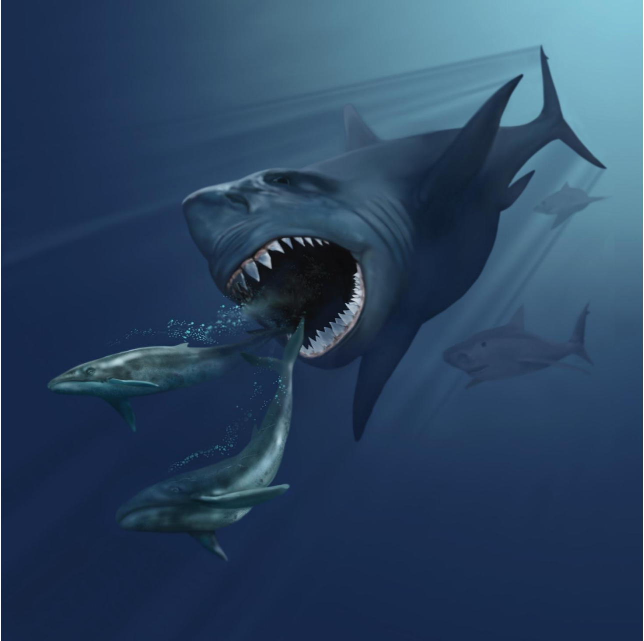
A megalodon hunting primeval whales

Megalodons are an extinct species of sharks. They grew up to 15 m in length.